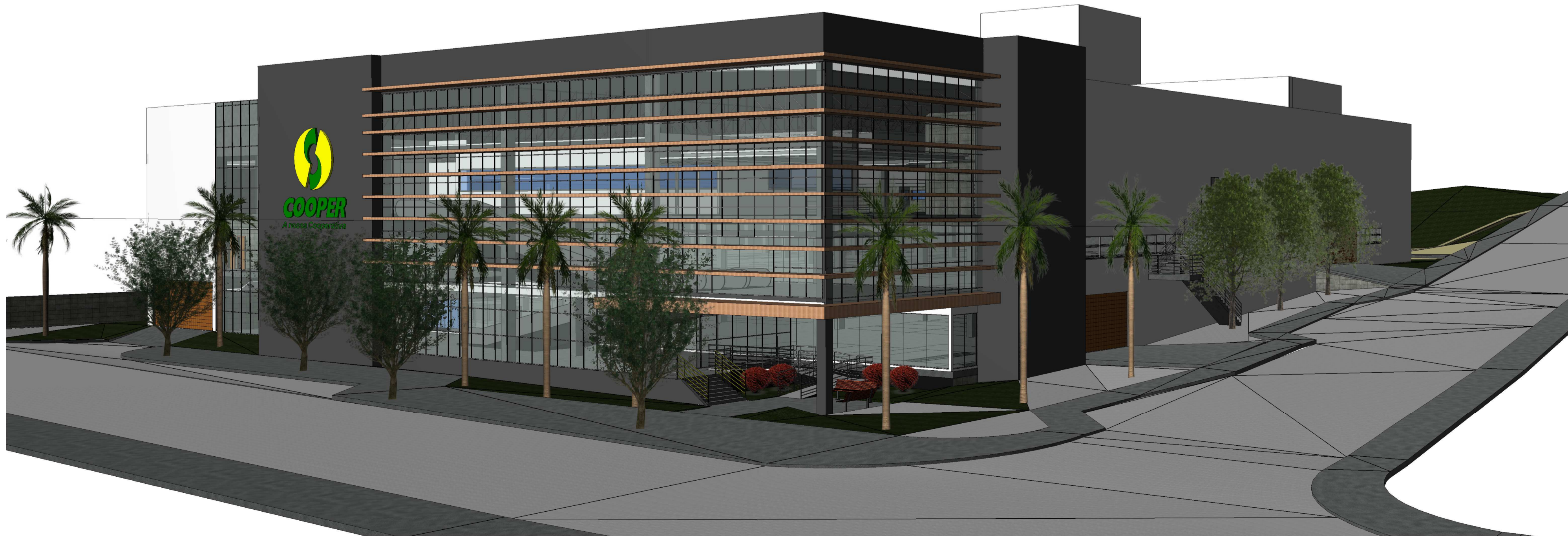
2 VISTA EXTERNA 1