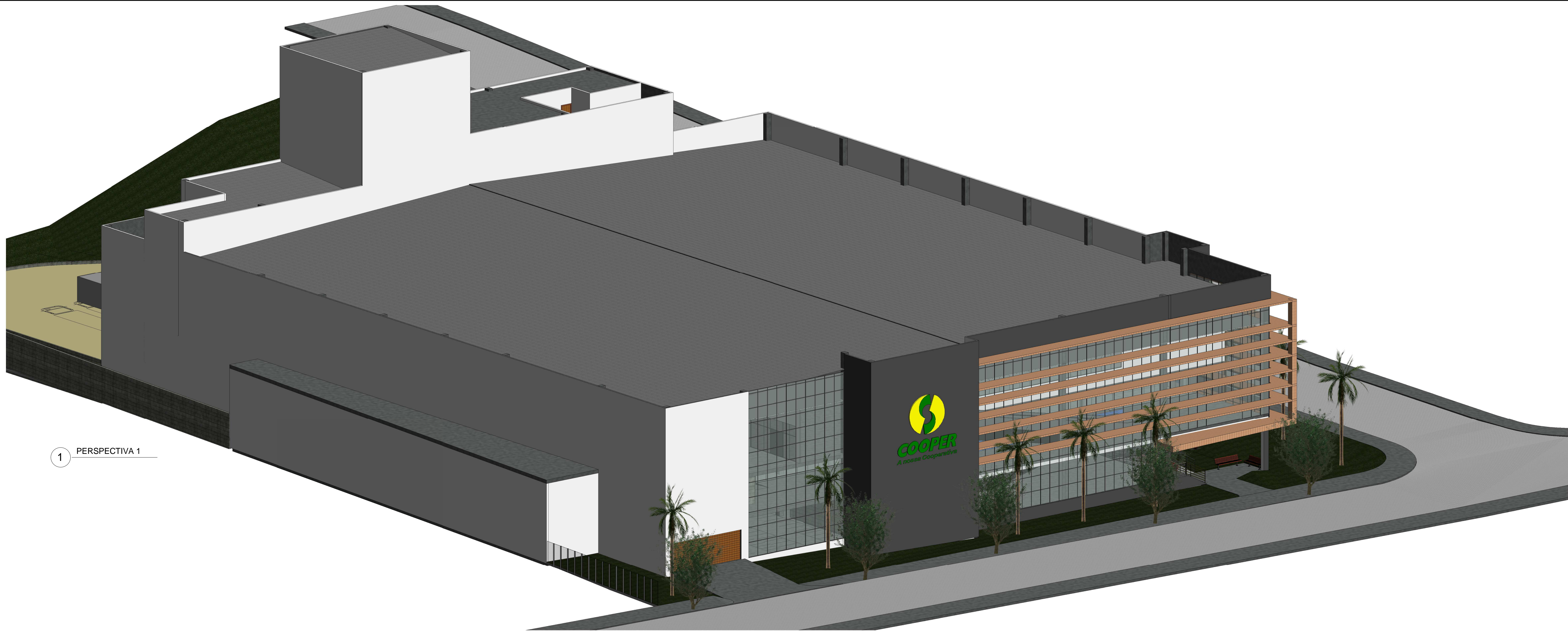
1 PERSPECTIVA 1