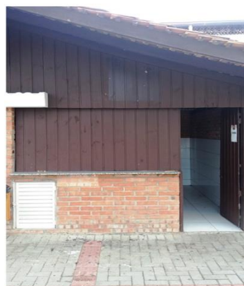
Quiosque 02 (com coifa)