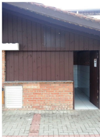
Quiosque 02 (com coifa)