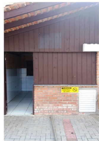
Quiosque 03 (com coifa)