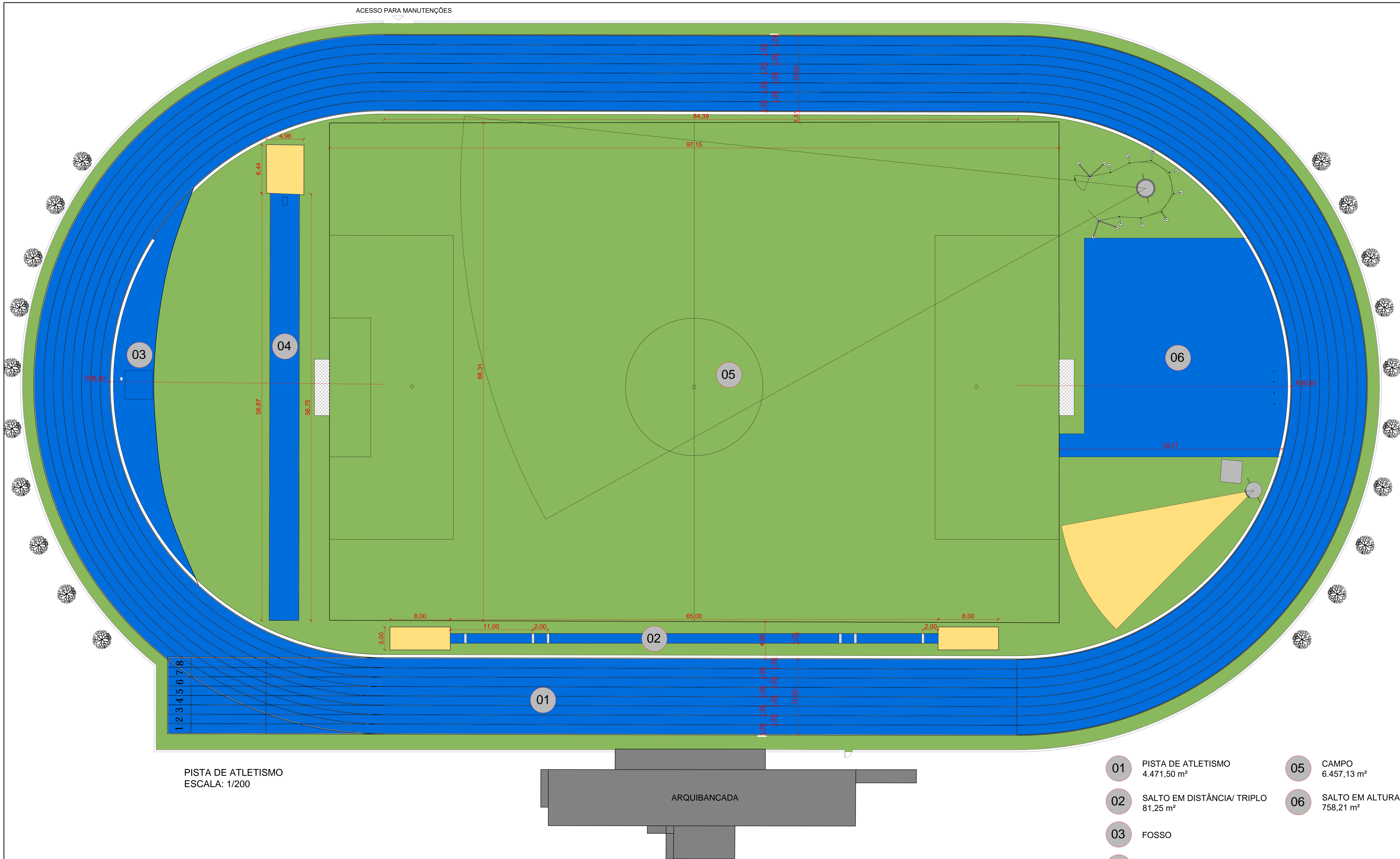
PISTA DE ATLETISMO ESCALA: 1/200