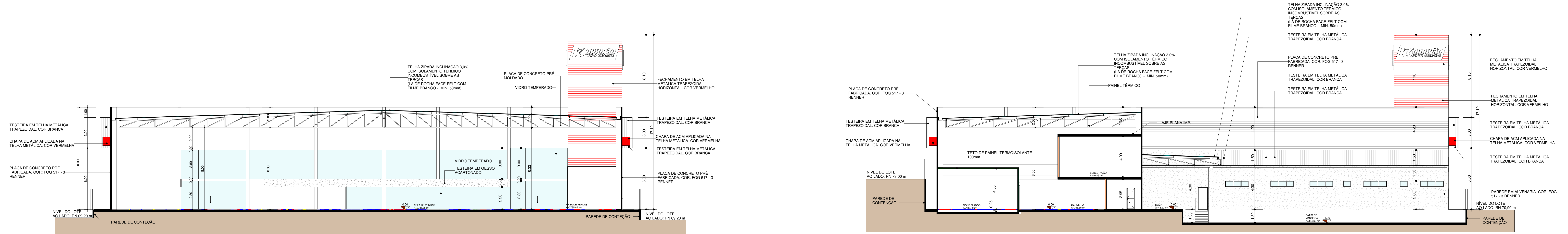
02 CORTE 02 ESCALA 1 : 125