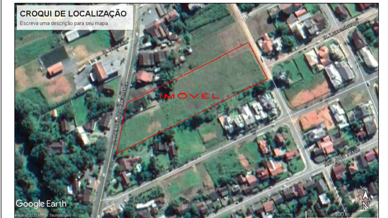
CROQUI DE LOCALIZAÇÃO IMAGEM GOOGLE EARTH