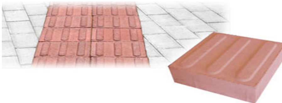
Figura 1 – Imagem representativa de instalação de piso podotátil guia em paver