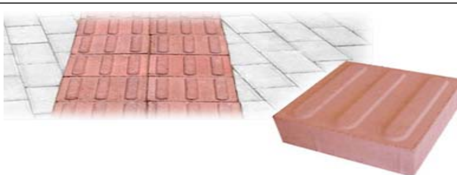
Figura 1 – Imagem representativa de instalação de piso podotátil guia em paver

Utilizar piso tátil direcional de concreto para sinalização, o qual deverá ser assentado sobre areia e apresentar resistência \geq 35 Mpa comprovado por laudo técnico e atender as especificações técnicas da ABNT (NBR 9781/2013), ou conforme diretrizes estabelecidas pela CONTRATANTE durante a execução.