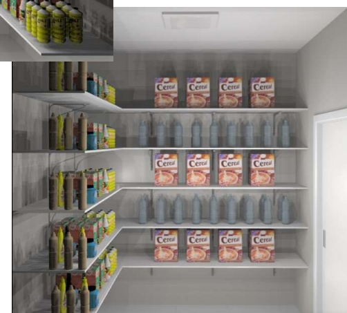
IMAGEM VISTA B

Cliente: PREFEITURA MUNICIPAL DE TIMBÓ Projeto: UNIDADE DE EDUCAÇÃO INFANTIL Ambiente: DESPENSA