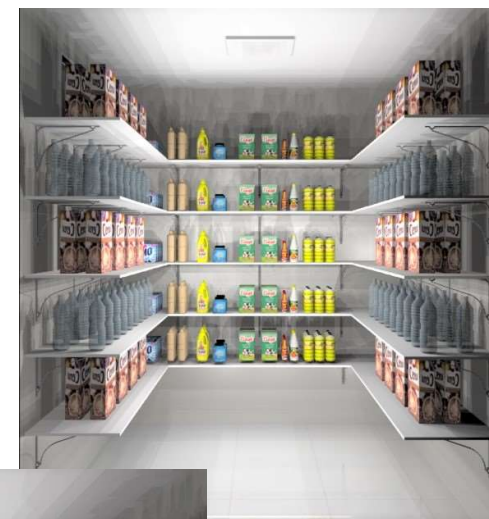
IMAGEM VISTA A

Prateleiras com espessura de 2,5cm 3 mãos francesas em cada uma delas para sustentação da mesma