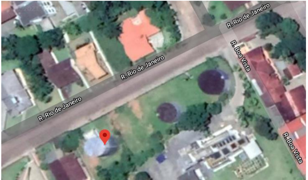
Reservatório 02: https://goo.gl/maps/yvCHY82QzE7i4oug8