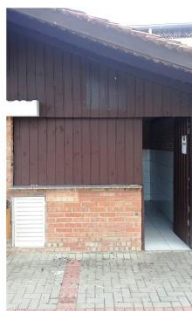
Quiosque 02 (com coifa)