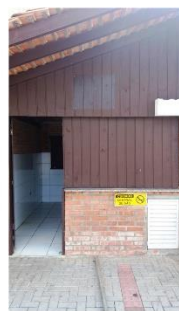
Quiosque 03 (com coifa)