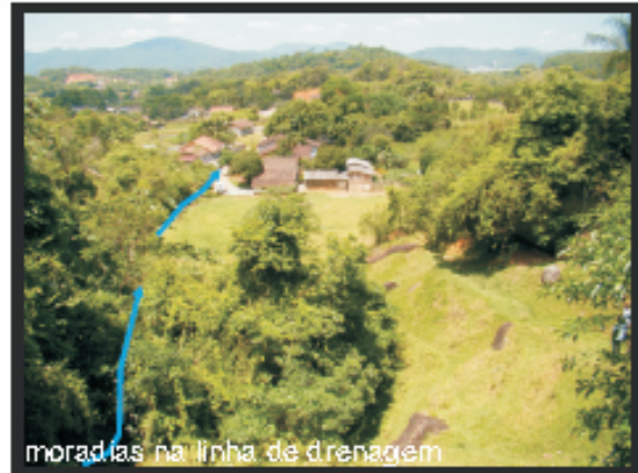
moradias na linha de drenagem

Ponto de Referência - 22J / UTM_N: 7029319 / UTM_E: 669883