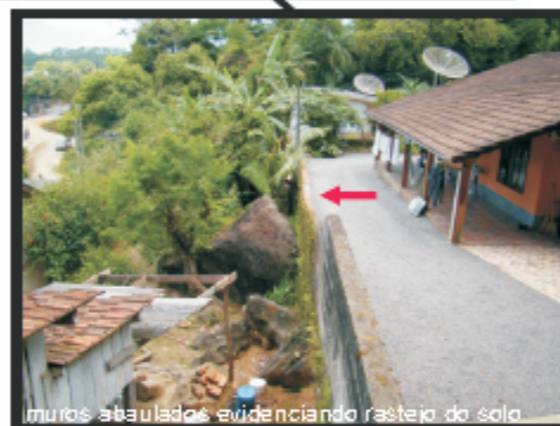
muros abaulados evidenciando rastejo do solo