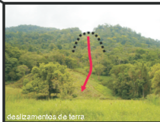
deslizamentos de terra