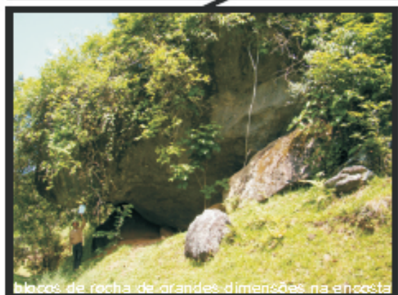
blocos de rocha de grandes dimensões na encosta