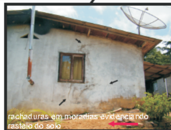
rachaduras em moradias evidenciando rastejo do solo