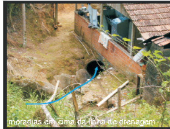
moradias em cima da linha de drenagem