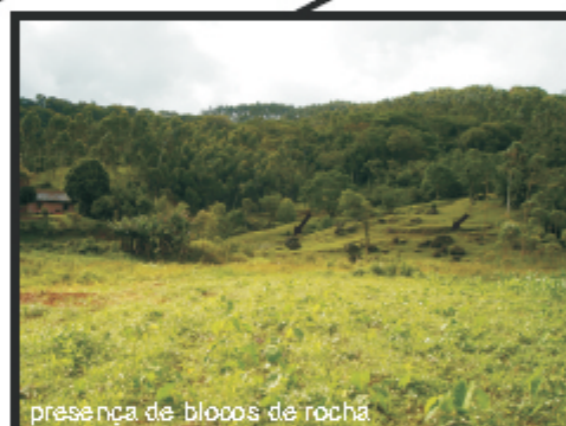
presença de blocos de rocha