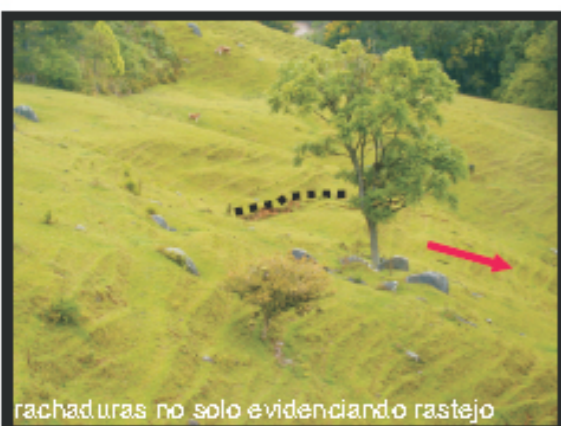
rachaduras no solo evidenciando rastejo