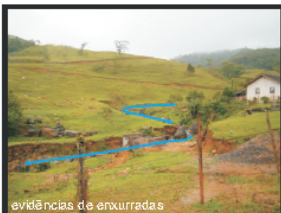
evidências de enxurradas