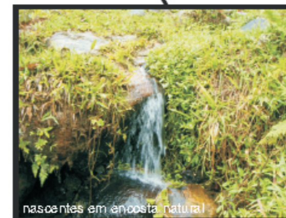
nascentes em encosta natural