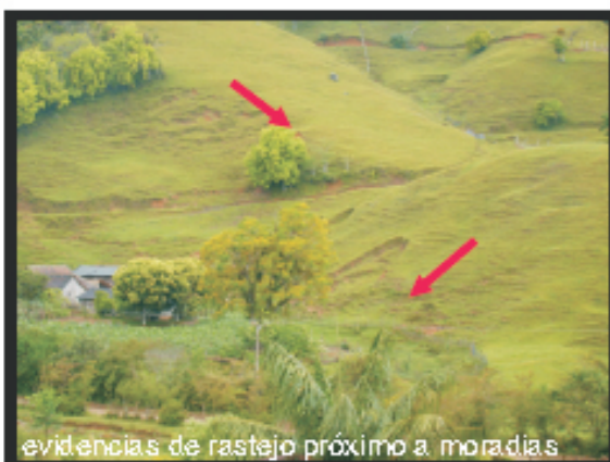
evidências de rastejo próximo a moradias