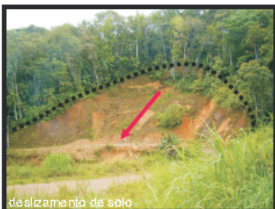
deslizamento de solo