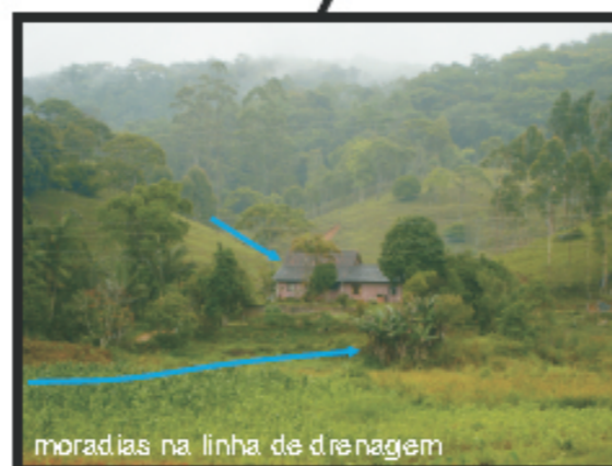
moradias na linha de drenagem