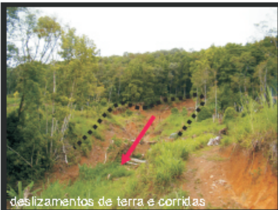
deslizamentos de terra e corridas

Equipe de Campo Bruno Eildorf Deyna Pinho