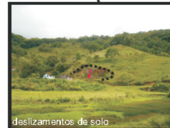
deslizamentos de solo