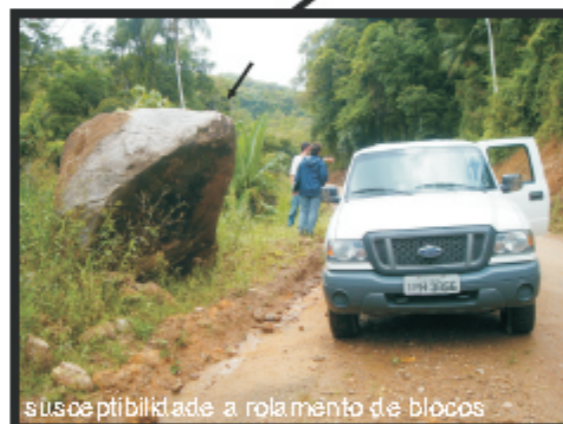
susceptibilidade a rolamento de blocos