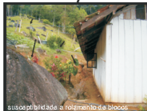
susceptibilidade a rolamento de blocos