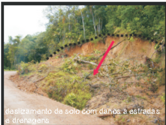
deslizamento de solo com danos a estradas e drenagens