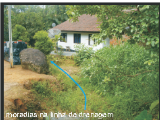
moradias na linha de drenagem