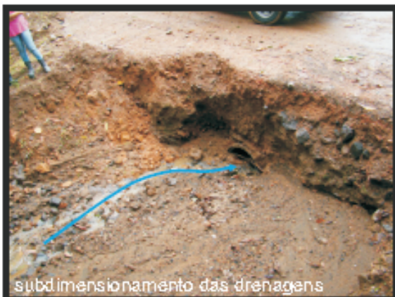
subdimensionamento das drenagens