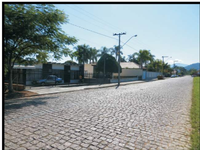
Tipo de ocupação.