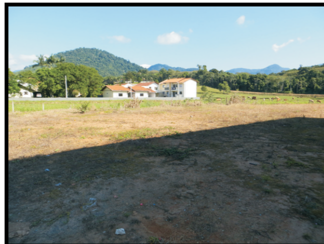
Tipo de ocupação.