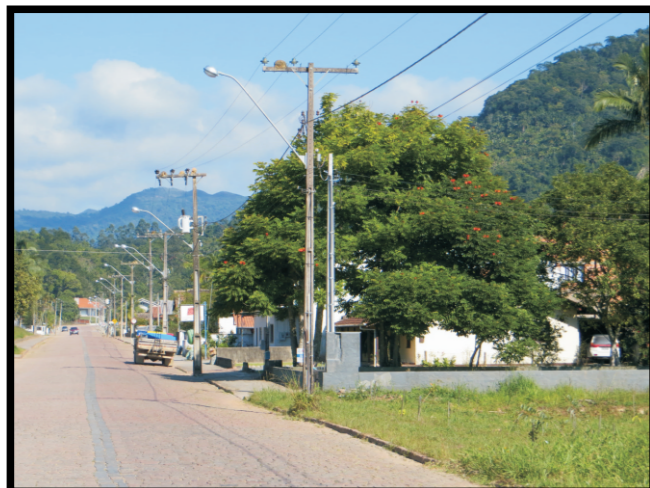
Tipo de ocupação.

SC_TI_SR_17_CPRM Localização: CAPITAIS/NAÇÕES UTM 22 J 670654 E 7033795 N