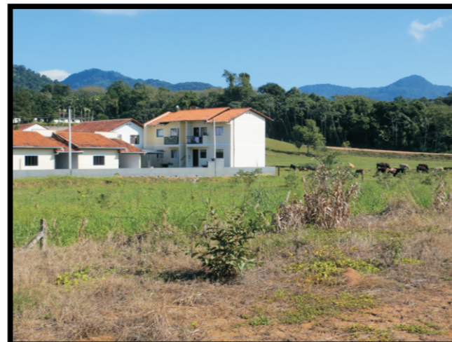
Tipo de ocupação.

Descrição: Ocupação urbana em processo de expansão localizada na planície de inundação do Rio do Cedro, próximo à confluência com o Rio Benedito. Sistema fluvial meandrante composto por depósitos aluvionares de idades holocênicas, constituídos por seixos, areias finas a grossas, com níveis de cascalhos, lentes de material silto-argiloso e restos de matéria orgânica. Estes sedimentos estão relacionados a planícies de inundação, barras de canal e canais fluviais atuais, por vezes capeados por sedimentos coluvionares.