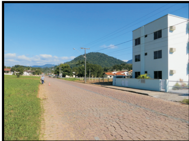
Tipo de ocupação.