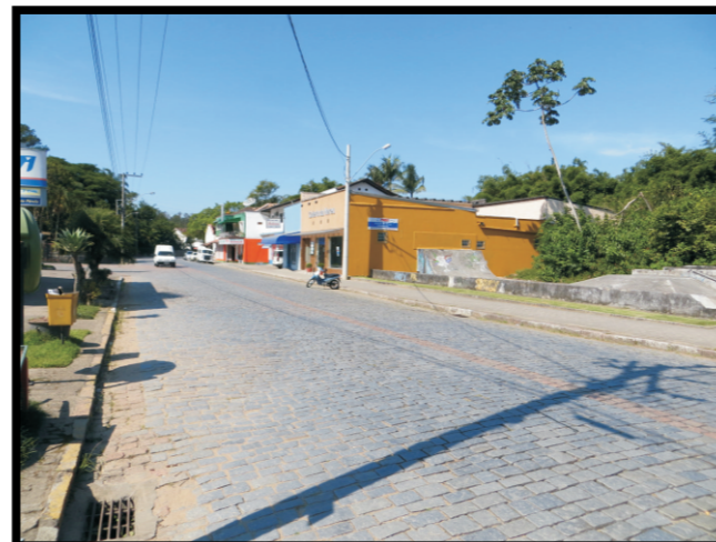
Tipo de ocupação.

Descrição: Ocupação urbana consolidada localizada em planície de inundação formada pela confluência dos Rios do Cedro e Benedito. Sistema fluvial meandrante composto por depósitos aluvionares de idades holocênicas, constituídos por seixos, areias finas a grossas, com níveis de cascalhos, lentes de material silto-argiloso e restos de matéria orgânica. Estes sedimentos estão relacionados a planícies de inundação, barras de canal e canais fluviais atuais, por vezes capeados por sedimentos coluvionares. Edificações residenciais e comerciais predominantemente de alvenaria e diversos edifícios. Baixa vulnerabilidade das edificações. Vias predominantemente pavimentadas, com sistema de drenagem pluvial. Sistema de tratamento de esgoto sanitário por meio de fossa/filtro individual. Setor atingido por inundação em 2011.