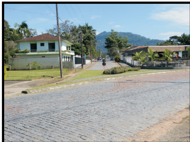
Tipo de ocupação.

SC_TI_SR_21_CPRM Localização: CENTRO/IMIGRANTES UTM 22 J 671989 E 7031229 N