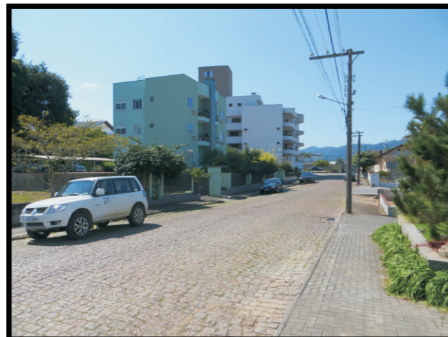
Tipo de ocupação.