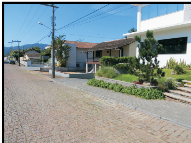
Tipo de ocupação.