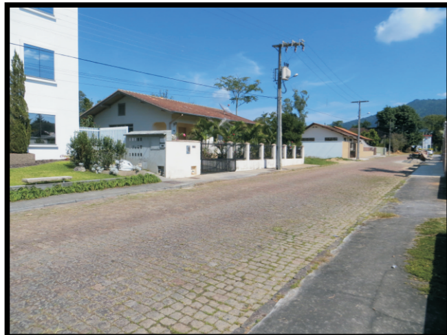
Tipo de ocupação.