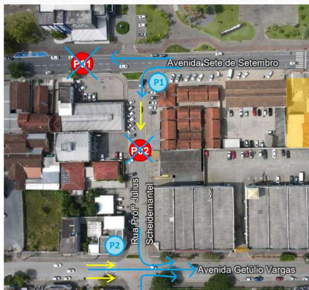
Figura 1 – Pontos de contagem na quadra do empreendimento